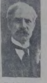
MAC DONALD, líder del partido laborista inglés.

Para el gobierno conservador británico resulta un grave problema la convocación a elecciones generales, que la oposición laborista viene reclamando hace tiempo.