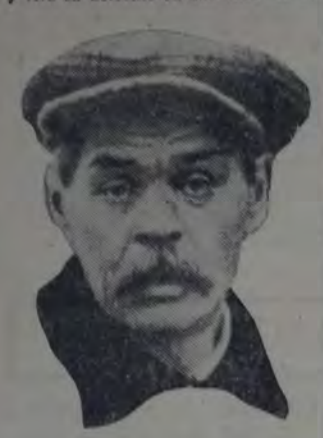
UNO DE LOS MAS RECIENTES retratos de Gorki.

Hace ahora veinte años, Máximo Gorki, prófugo de la Rusia de los zarres, donde su vida, después de las jornadas de San Petersburgo no se hallaba evidentemente segura, buscó y encontró en Capri, en una modesta casita situada detrás de la plaza, un refugio que le permitiera restampar su espíritu exhausto a raíz de las durísimas luchas sostenidas en Patria, y allí quedó aislado, dedicándose exclusivamente a su arte. Hoy el maestro tiene sesenta años y vive en Sorrento en una villa "El Sol".