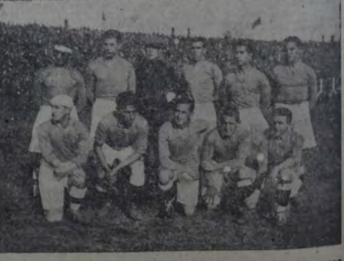
CUADRO DEL CELTA, DE VIGO, QUE VOLVIO A PERDER EN SU PARTIDO FRENTE A OTRO COMBINADO LOCAL.