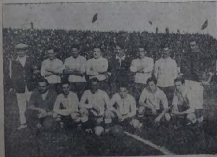
CONJUNTO DE LA ASOCIACION AMATEURS ARGENTINA DE FUTBOL, QUE VENIO AL CELTA POR 3 A 0.

A su vez los gallegos iniciaron algunos avances y en uno de ellos Lecube — que fué el delantero más peligroso