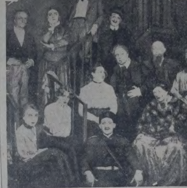
EN LA FIESTA ORGANIZADA EN SORRENTO EN HONOR DE GORKI, al cumplir sesenta años, el 30 de marzo de 1928.

La casa, en ese día, fue adornada de festones multicolores de los que pendían, como de los árboles de Navidad, juguetes relucientes, estrellitas plateadas, lamparitas minúsculas, y mil cosas relucientes; parecía más bien que se celebrara el cumpleaños de María, la nietecita, que no cuenta todavía cinco primaveras, que no el sexagésimo del abuelo.